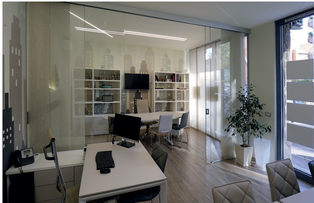
LO STUDIO IN PIAZZA SERGIO CORAZZINI