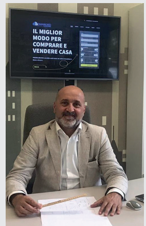
I TRE SOCI DI RN IMMOBILIARE SRL